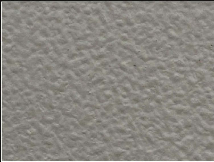
PINTU ELASTO V155