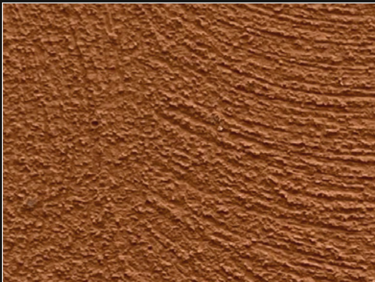
TEXTU ELASTO J122